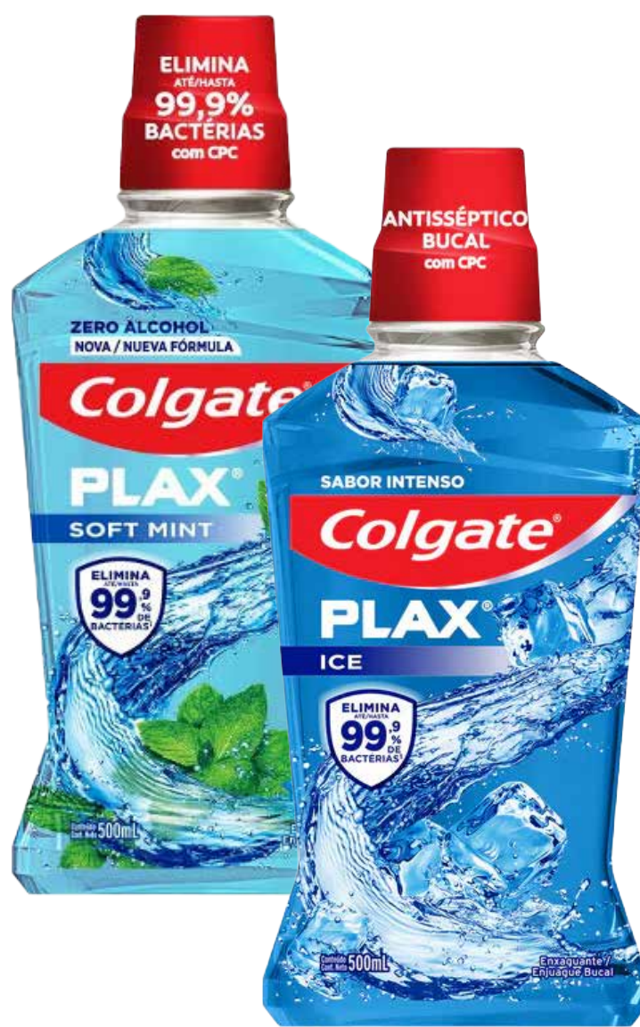
Enjuague Bucal Colgate soft mint / plax odor x 500 ml PLU: 3377-85987

$19.990 Mililitro a $ 61.50 60 Unds. Disponibles.