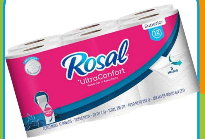
Papel Rosal Ultracomfort x 12 und x 28 m PLU: 127933

$13.950 Metro a $ 21.666 240 Unds. Disponibles.