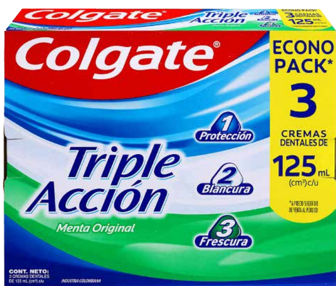
Crema Dental Colgate triple acción x 3 und x 125 ml PLU: 4077

$13.950 Metro a $ 21.666 240 Unds. Disponibles.