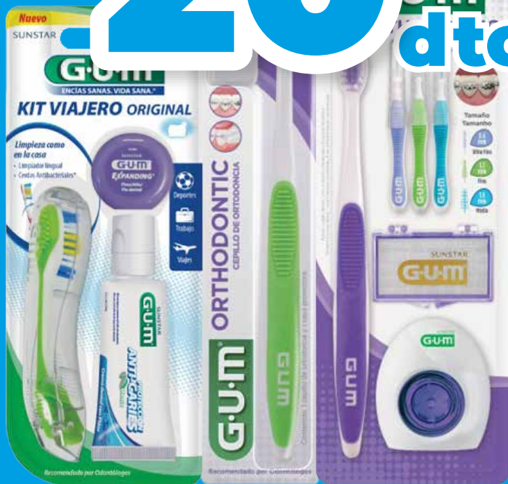
Cepillos dentales marca Gum