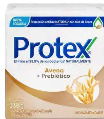
Jabón Protex Avena x 3 und x 110 g PLU: 23739 Precio Antes: $11.800 Precio Ahora:

$8.850 Gramo a $ 26,81 60 Unds. Disponibles.