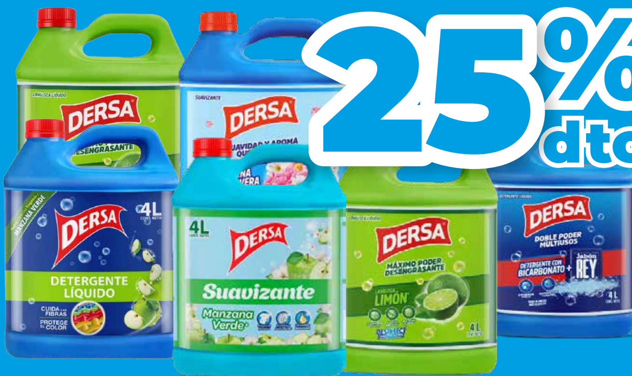
Galones Dersa x 4 litros