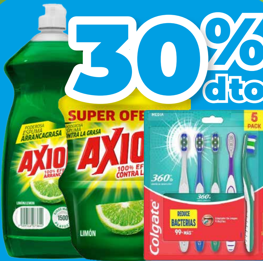
Lavalozaxión limón x 2 und x 450 g/ botella x 1.1 L - Cepillo dental Colgate 360 luminos pack x 5