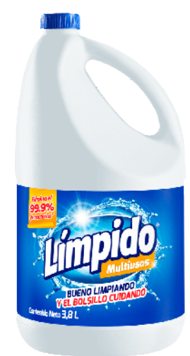
Blanqueador Límpido regular x 3.800 ml PLU: 18700

$8.850 Gramo a $ 26,81 60 Unds. Disponibles.